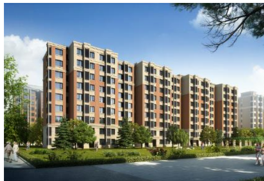
北京中建·山水名院