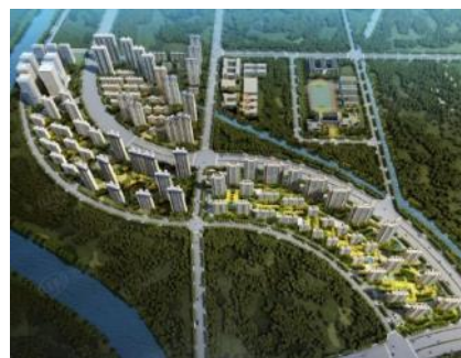
苏州中建·河风印月