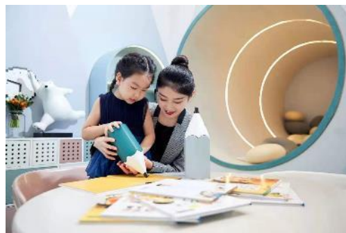
苏州中建·河风印月案场