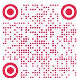
【舜宇集团有限公司】 小红书