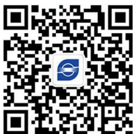
【舜宇集团招聘】 微信公众号